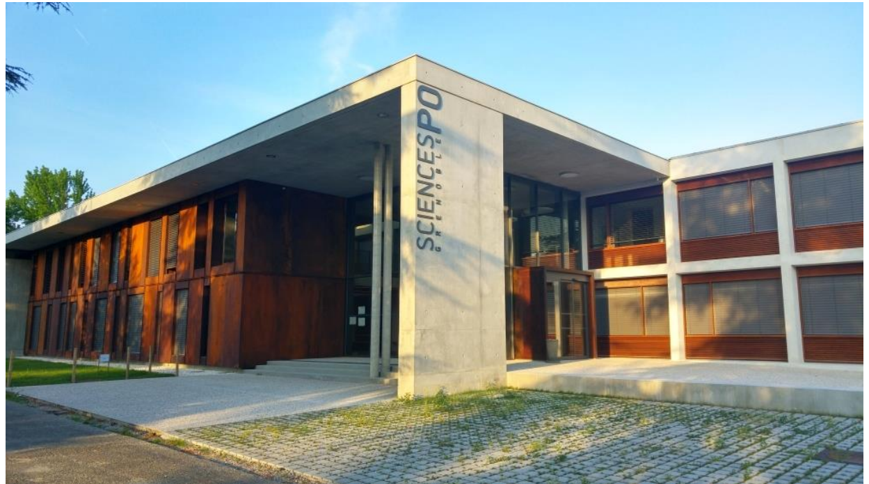
Hauptgebäude des IEP Grenoble