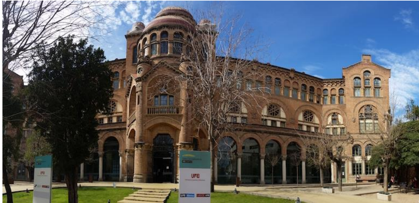
Hauptgebäude der Universität Autònoma de Barcelona