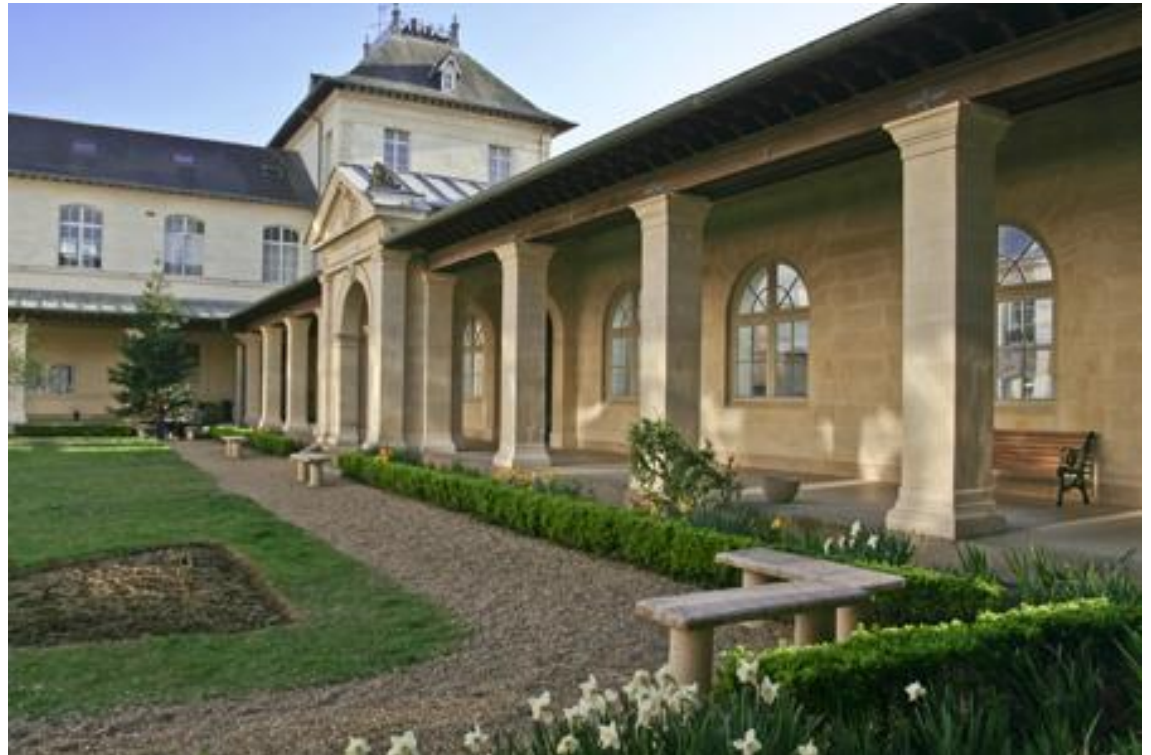
Hauptgebäude des IEP Rennes