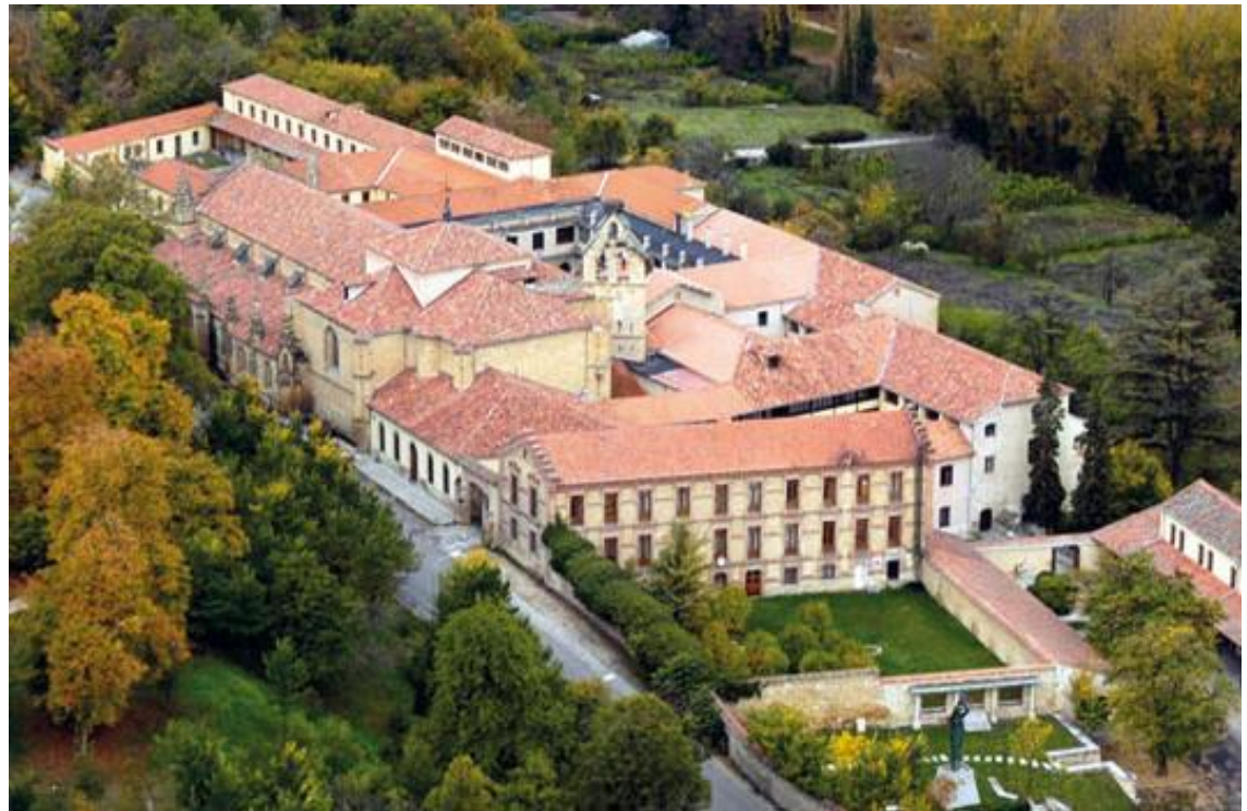
IE University im Kloster Santa Maria la Real