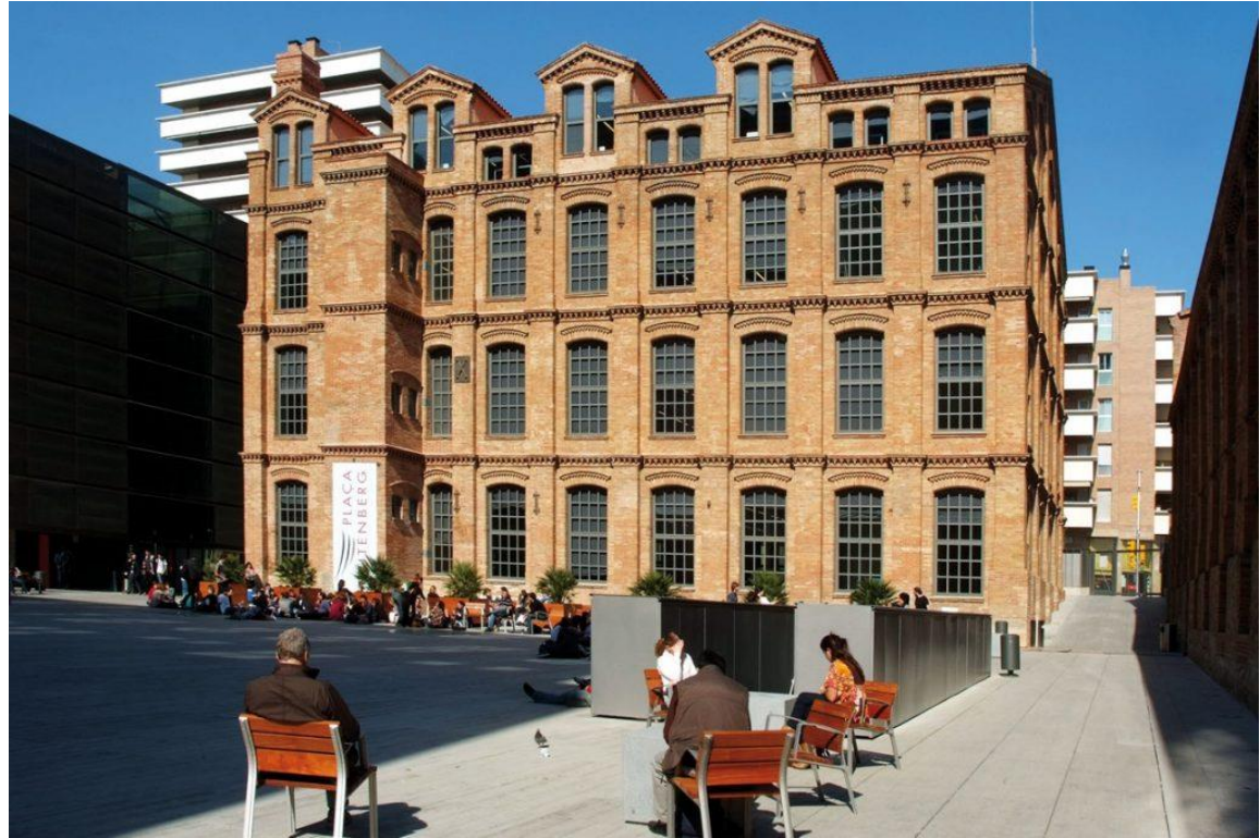
Ciutadella Campus der Pompeu Fabra