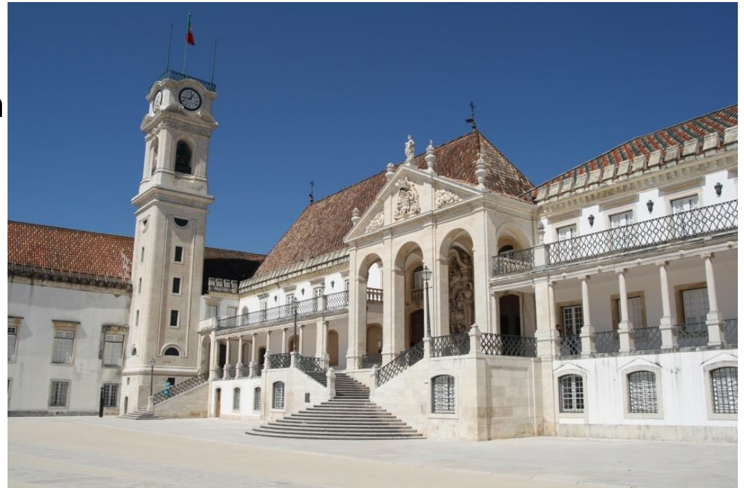
Hauptgebäude der Universidade de Coimbra