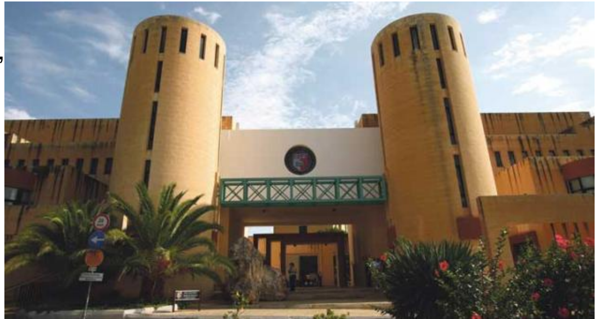
Hauptgebäude der Università Tà Malta