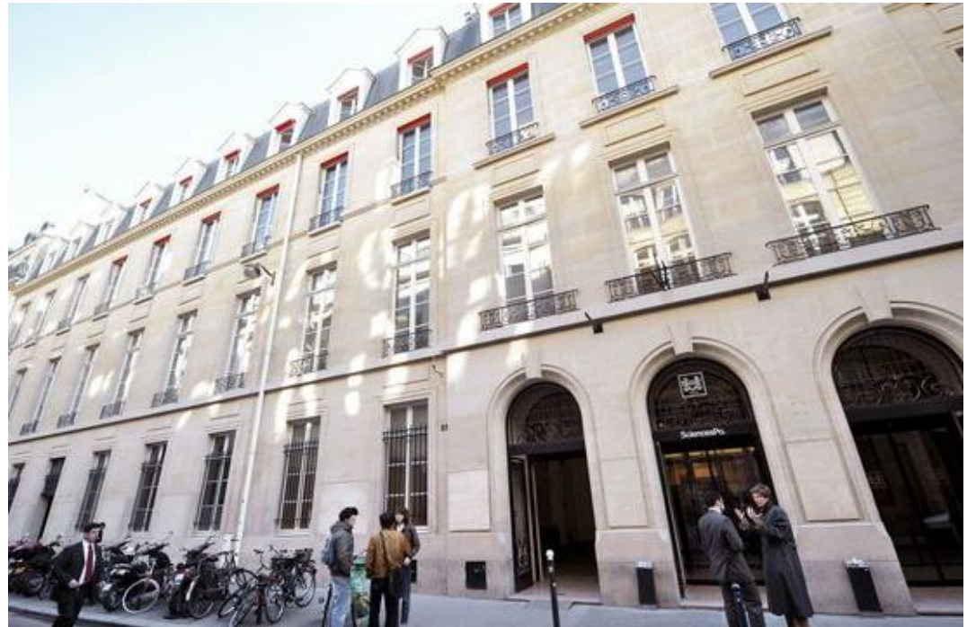
Hauptgebäude Sciences Po Paris