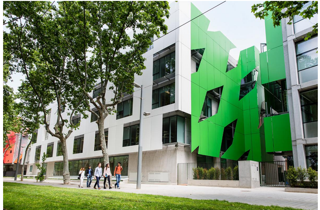
IBEI Gebäude Mercè Rodoreda