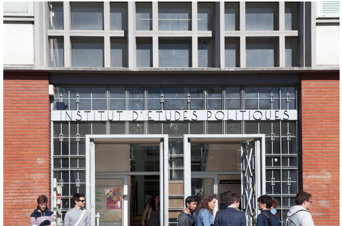
Haupteingang des IEP Toulouse