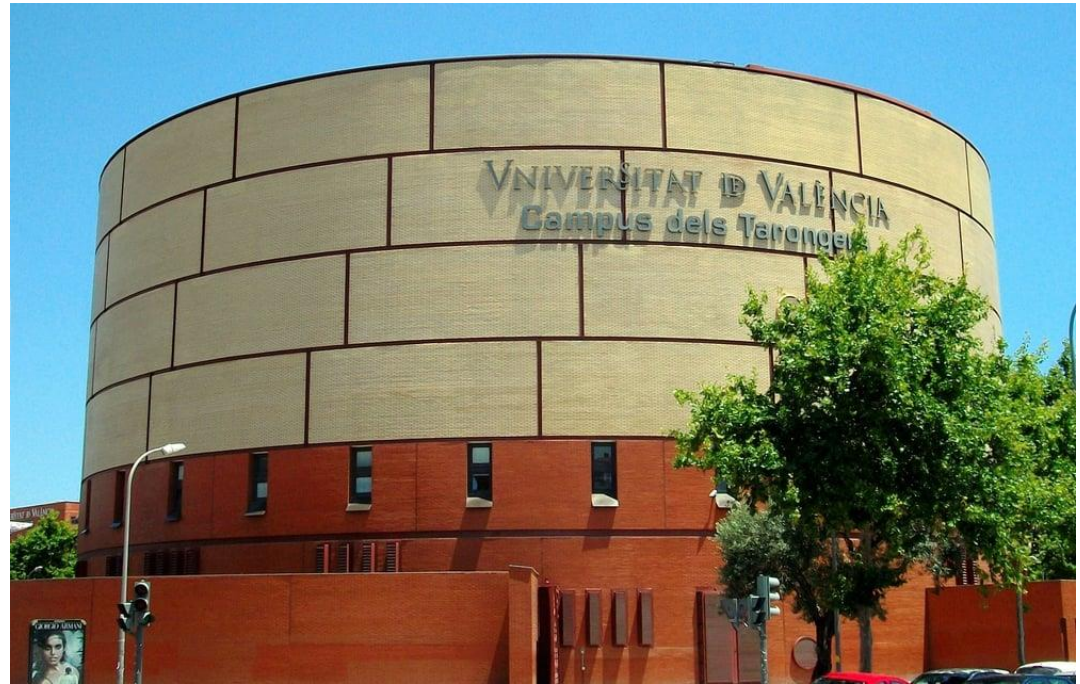
Campus dels Tarongers, Valencia