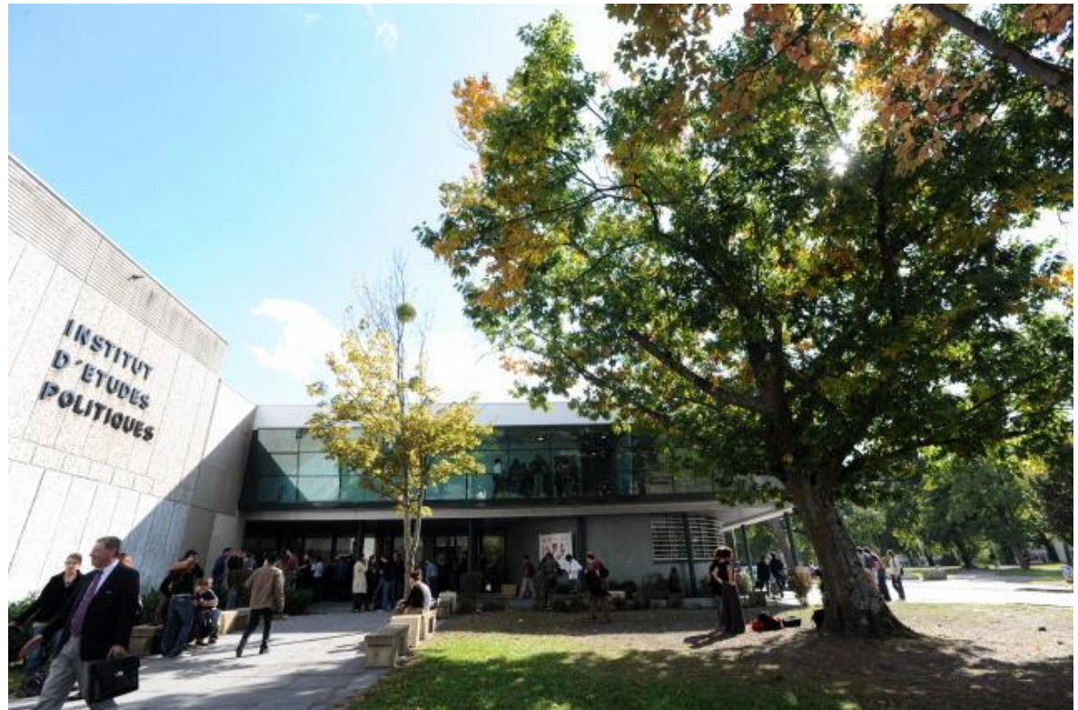
Hauptgebäude des IEP Bordeaux