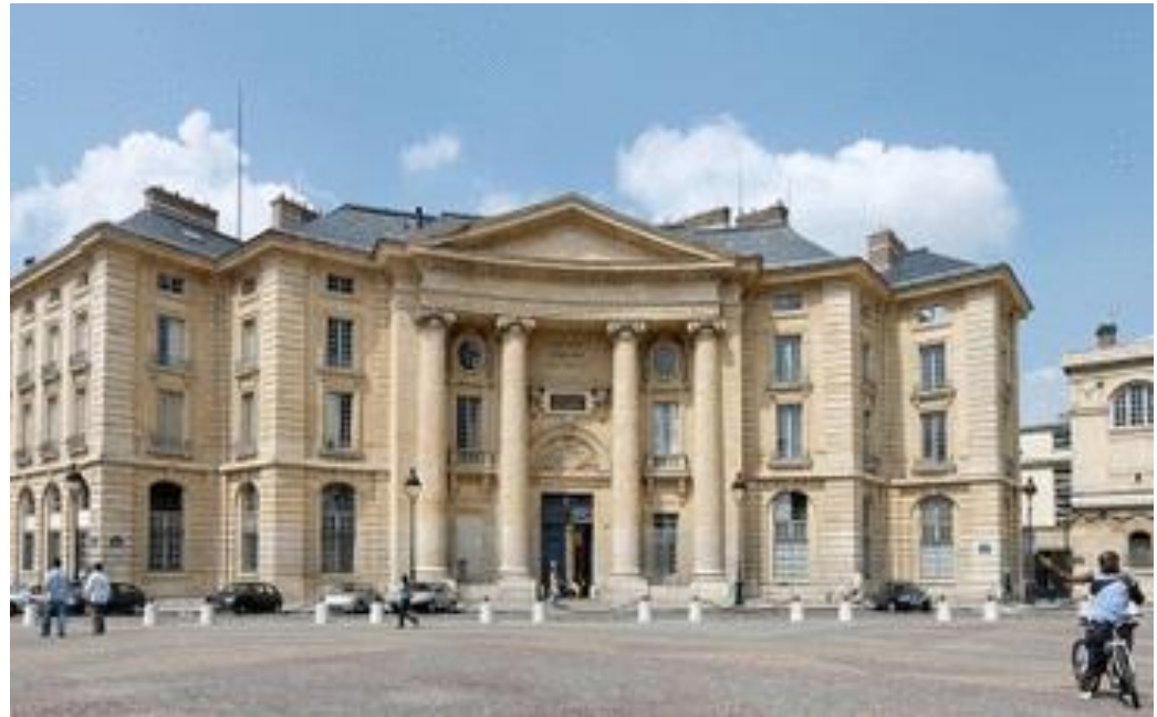
Hauptgebäude der Panthéon-Sorbonne