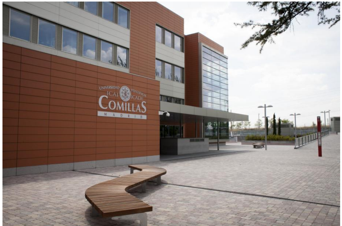
Campus Cantoblanco der Universidad Pontificia Comillas