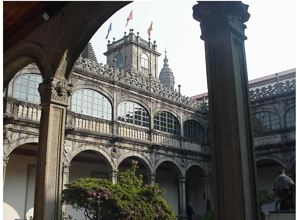
Hauptgebäude der Universidad de Santiago de Compostela