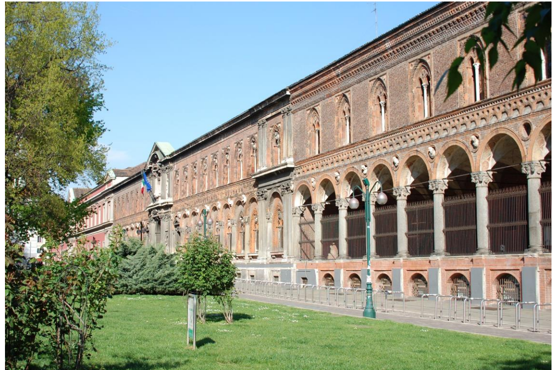
Hauptgebäude der Università degli Studi di Milano