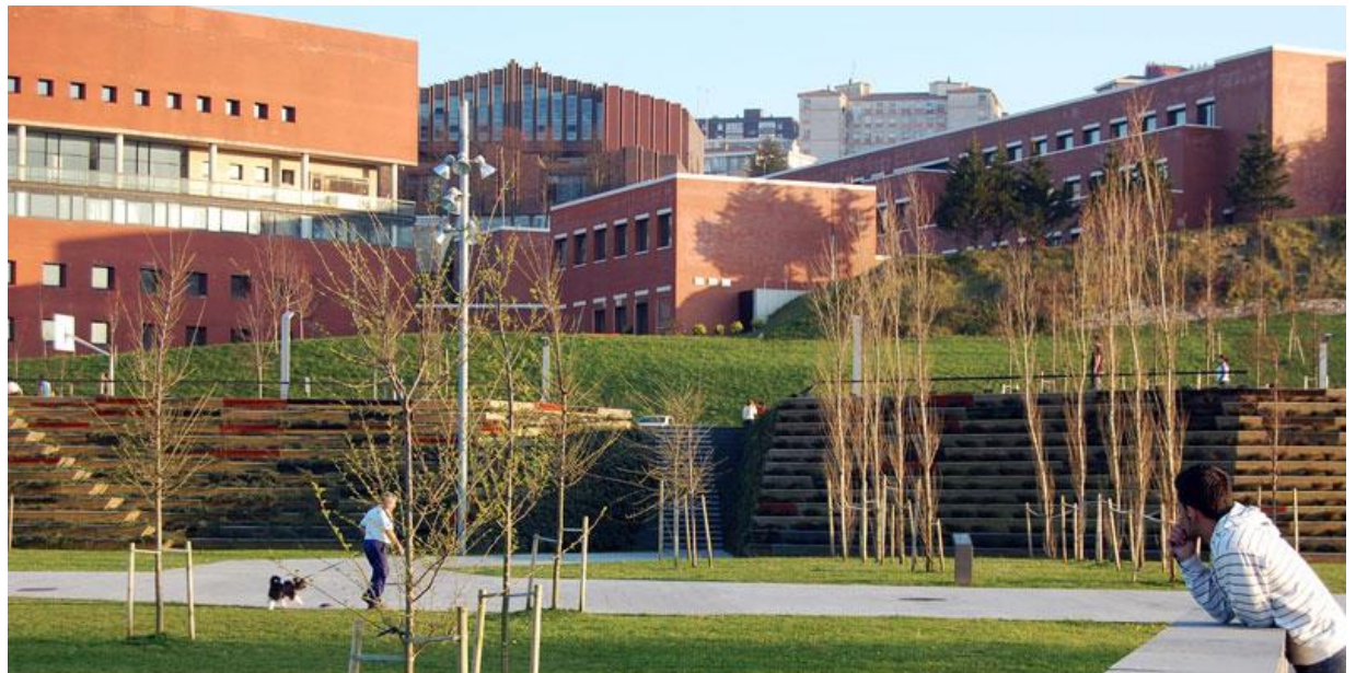
Hauptgebäude der Universidad de Cantabria