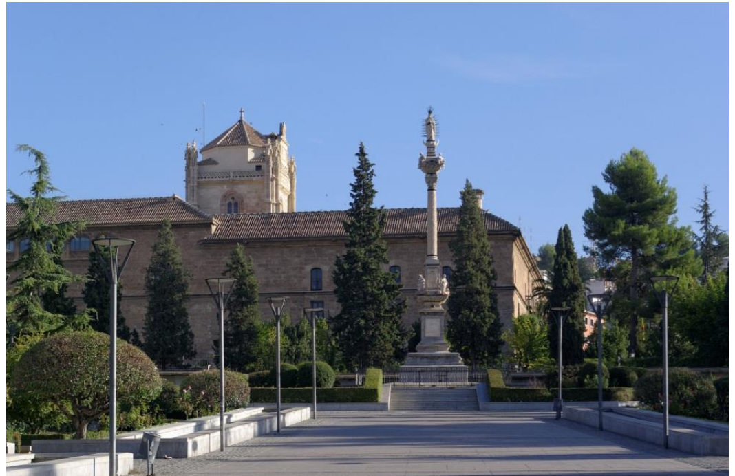
Hauptgebäude der Universidad de Granada