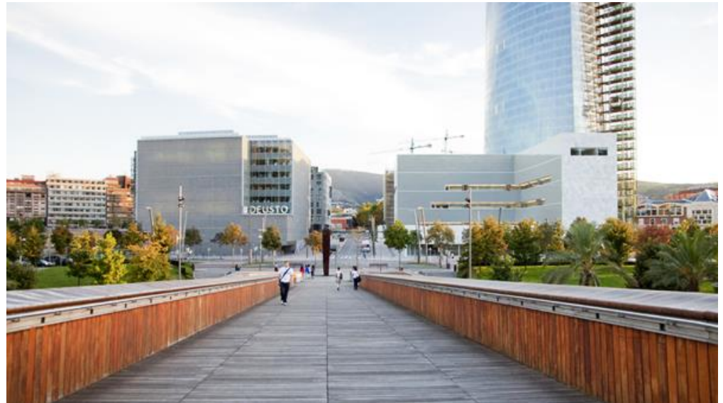
Universidad del País Vasco, Bilbao