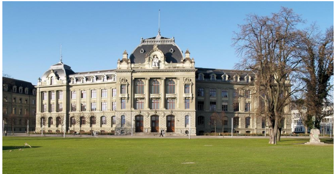
Hauptgebäude der Universität Bern