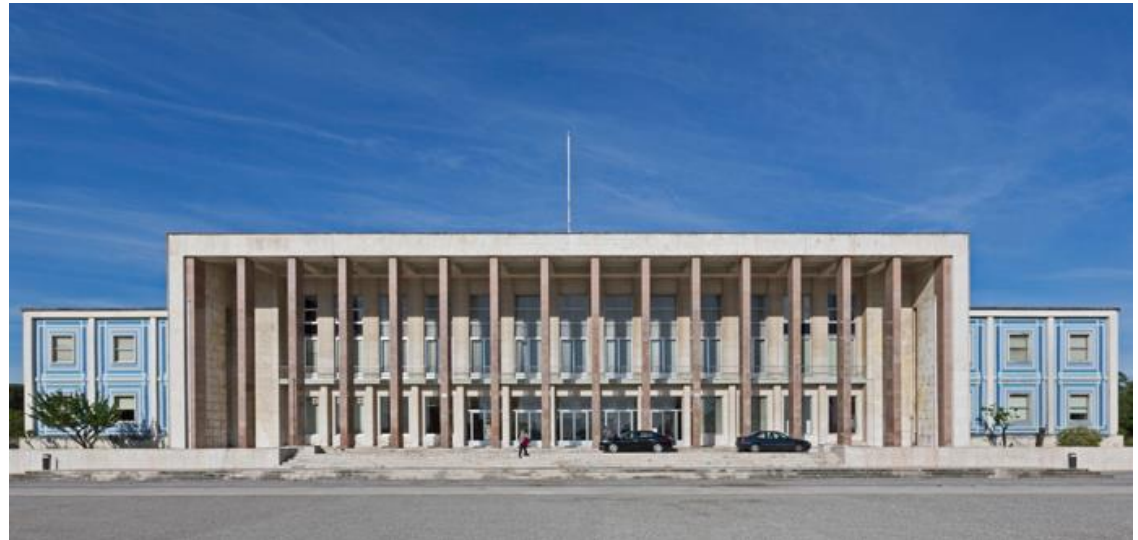
Hauptgebäude der Universidade de Lisboa