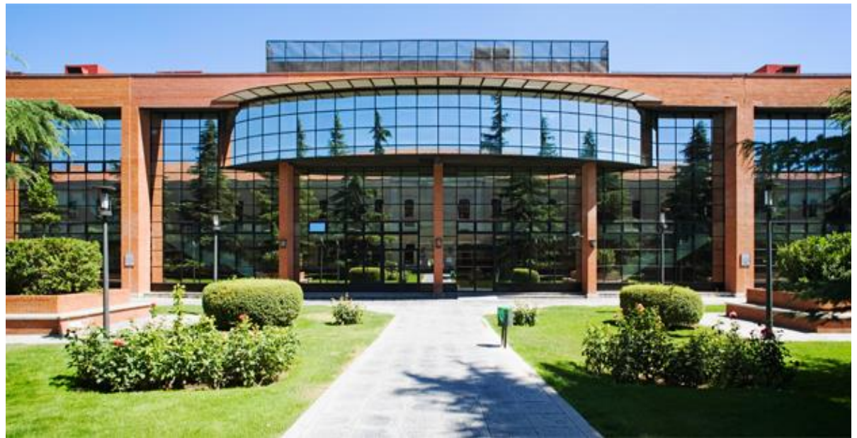
Hauptgebäude der Universidad Carlos III de Madrid