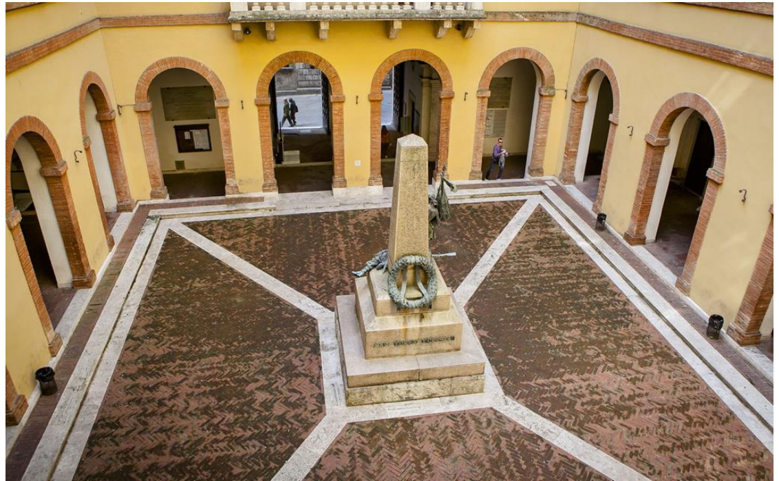
Haupteingang der Università di Siena