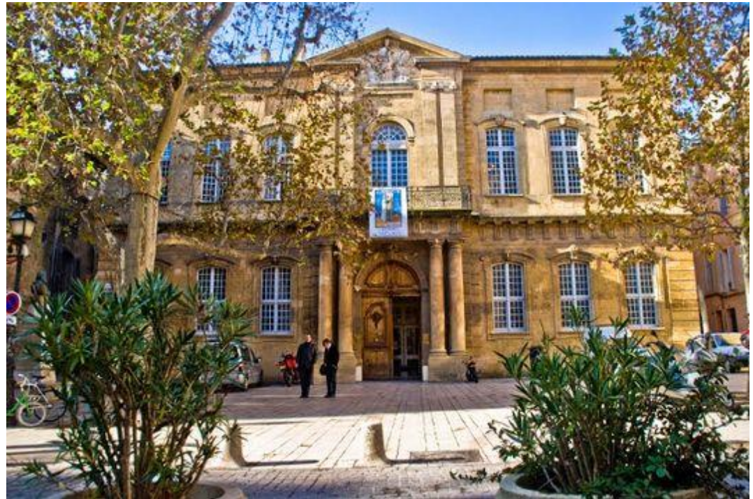
Hauptgebäude des IEP Aix-en-Provence