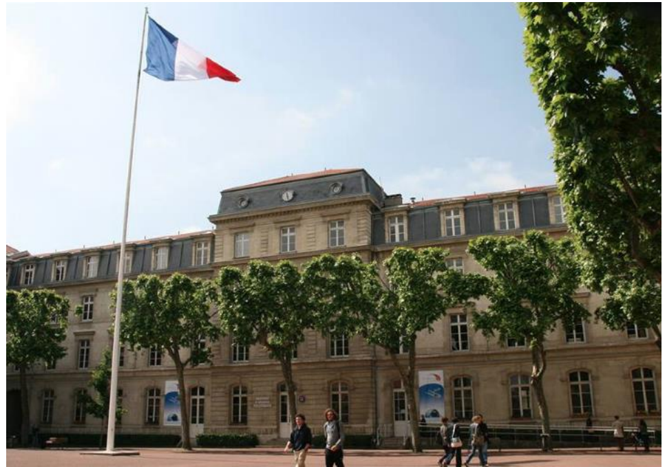
Hauptgebäude Campus Lyon (Centre Berthelot)