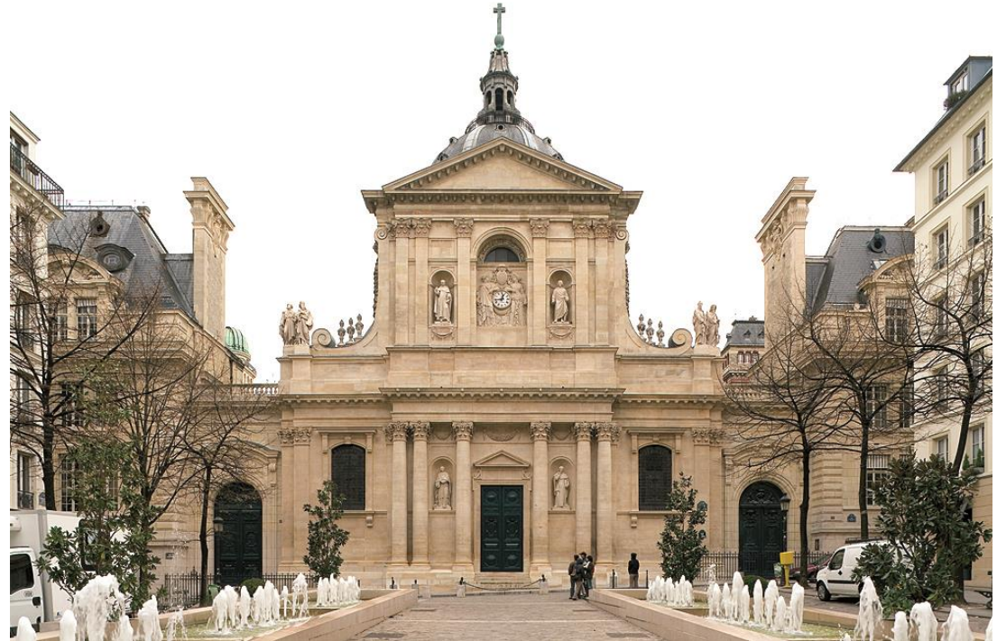
Hauptgebäude der Sorbonne Nouvelle