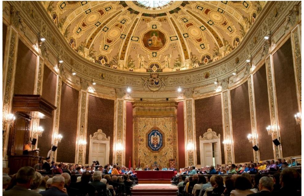
Universidad Complutense de Madrid