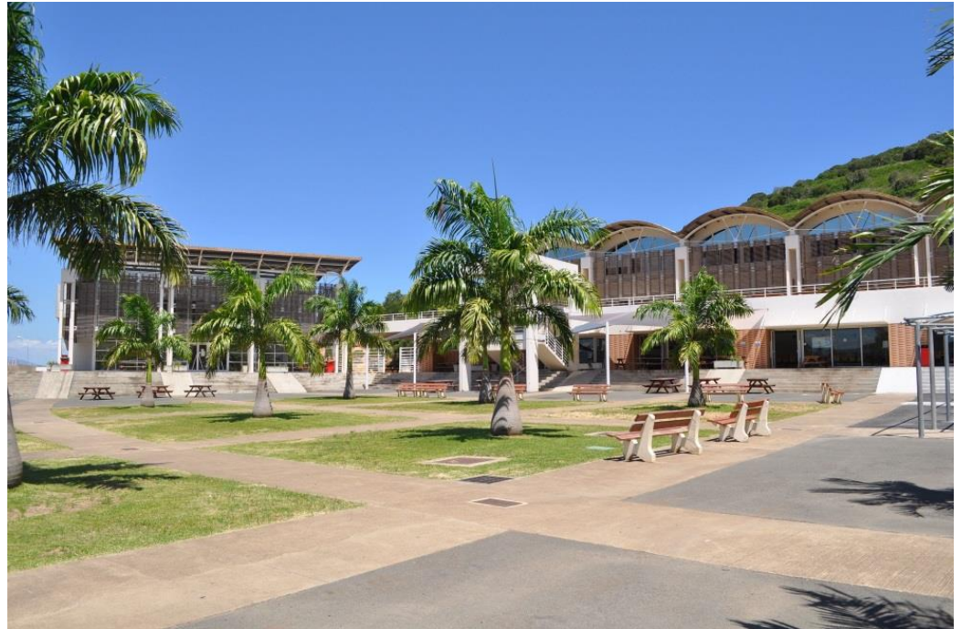
Campus der Universität de Nouvelle-Calédonie