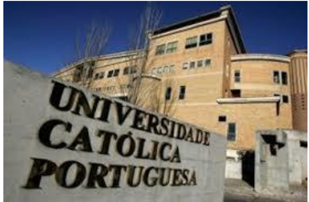
Bibliothek der Universidade Católica Portuguesa