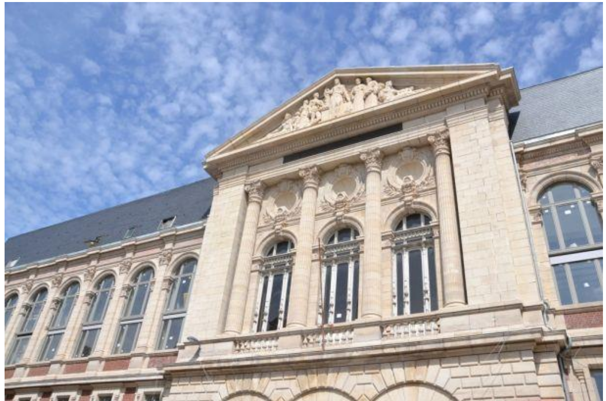
Le nouveau Sciences Po Lille