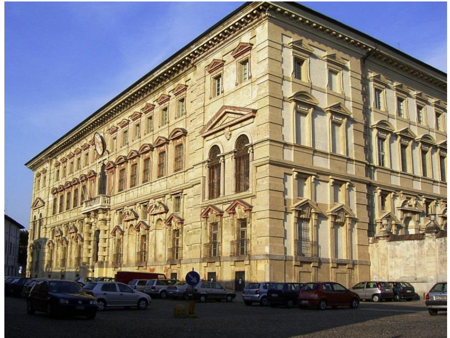
Hauptgebäude der Università di Pavia