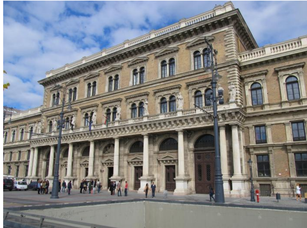
Hauptgebäude der Corvinus University