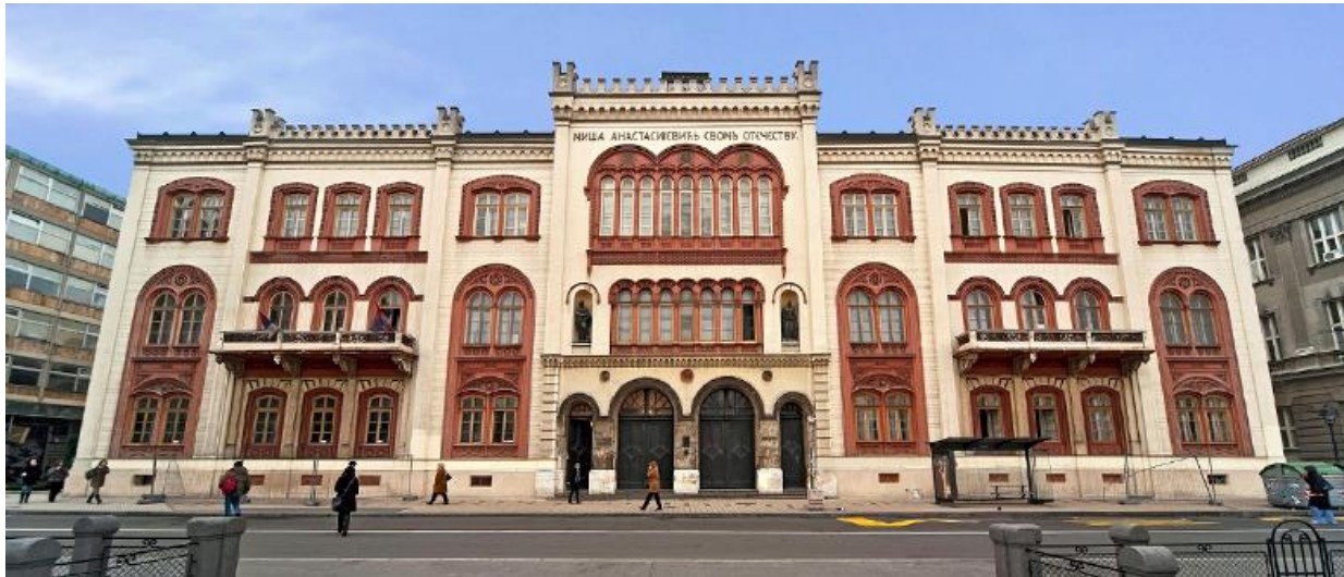
Hauptgebäude der Universität Belgrad