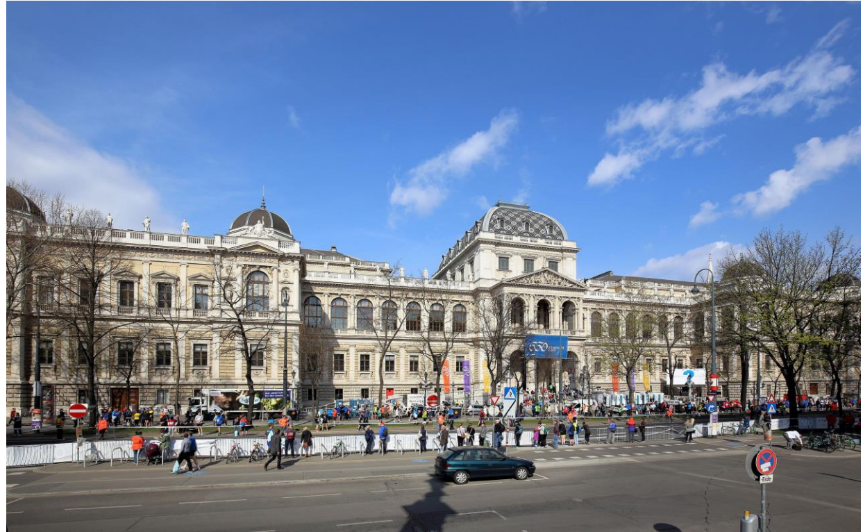
Hauptgebäude der Universität Wien