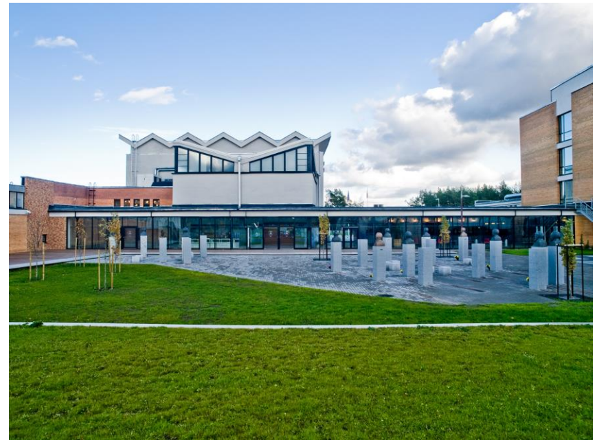
TalTech Conference Centre