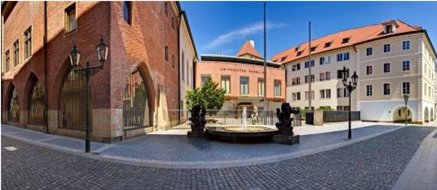
Hauptgebäude der Karls-Universität