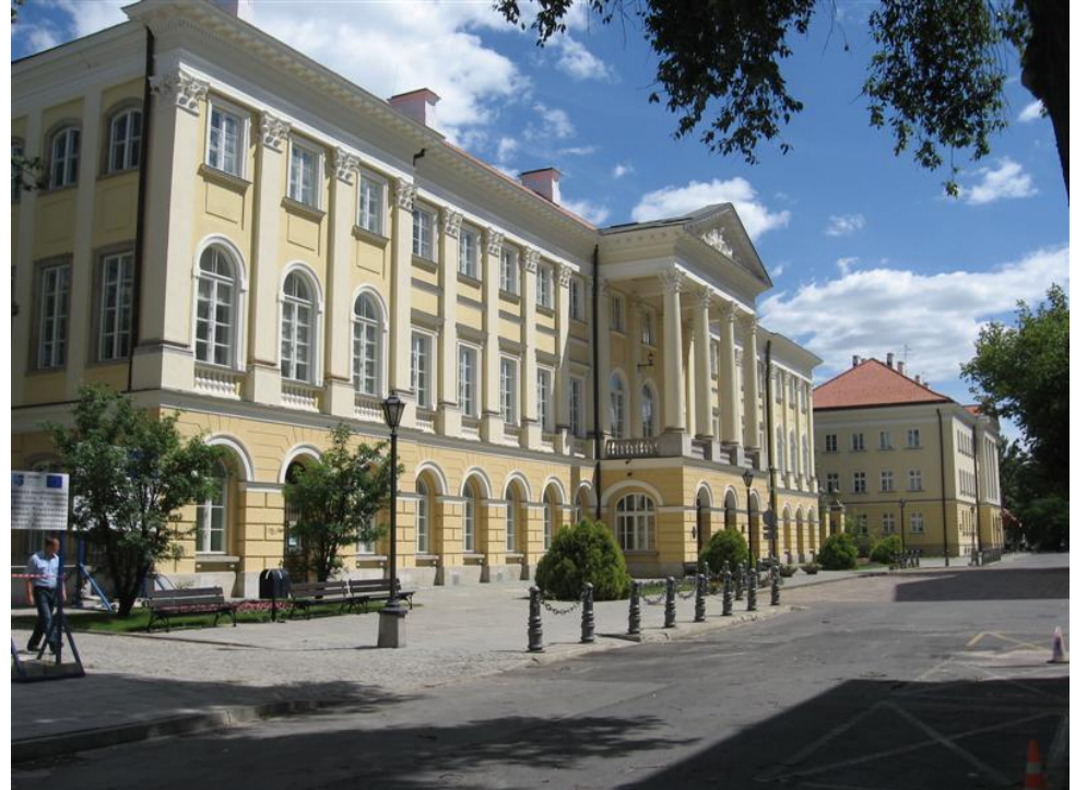
Hauptgebäude der Uni Warschau