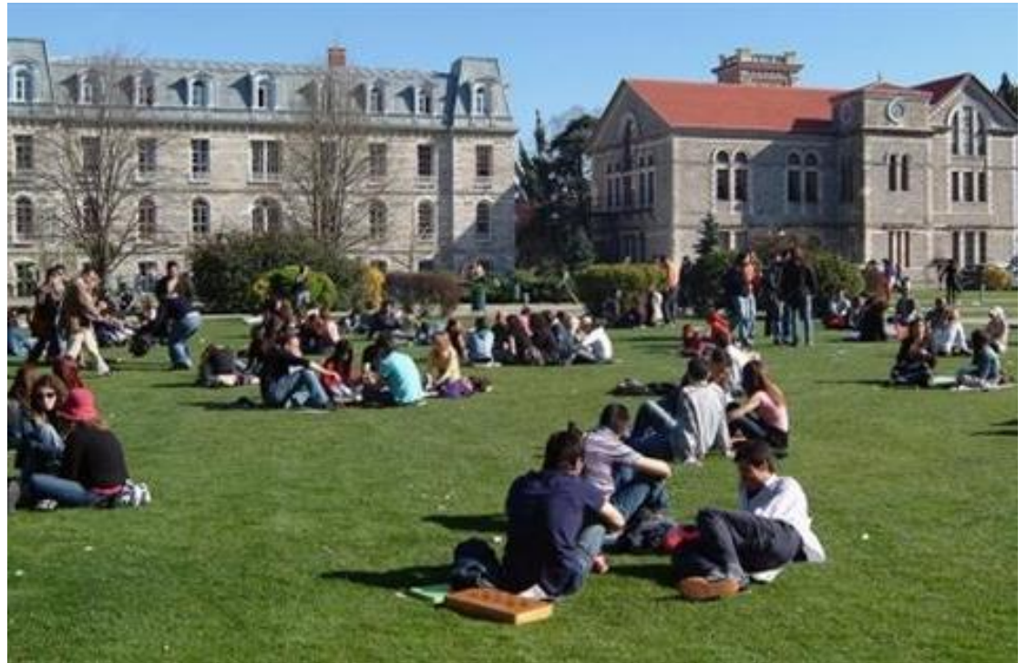
Südcampus der Bogazici University