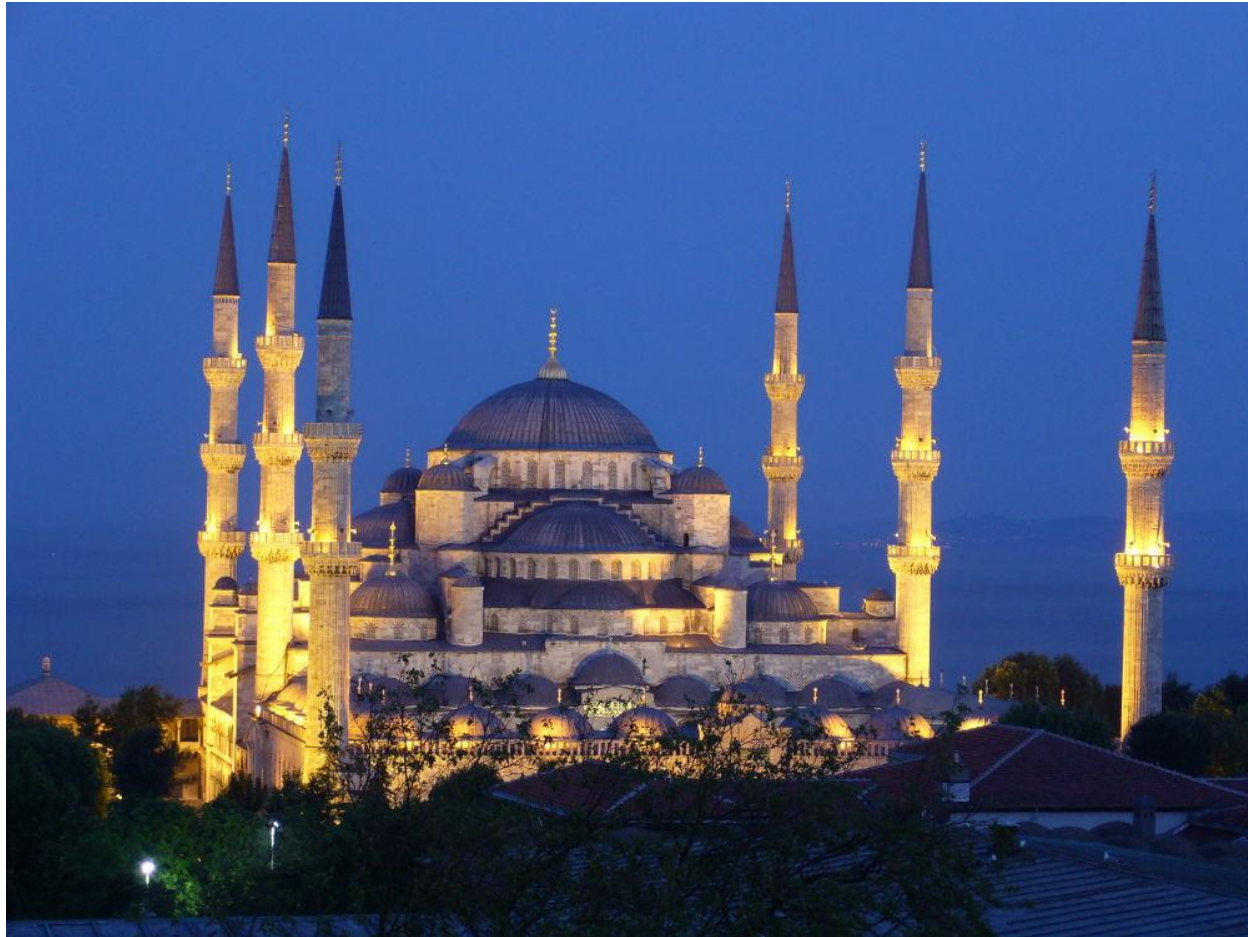
Blaue Moschee (Sultan-Ahmed-Moschee) in Istanbul