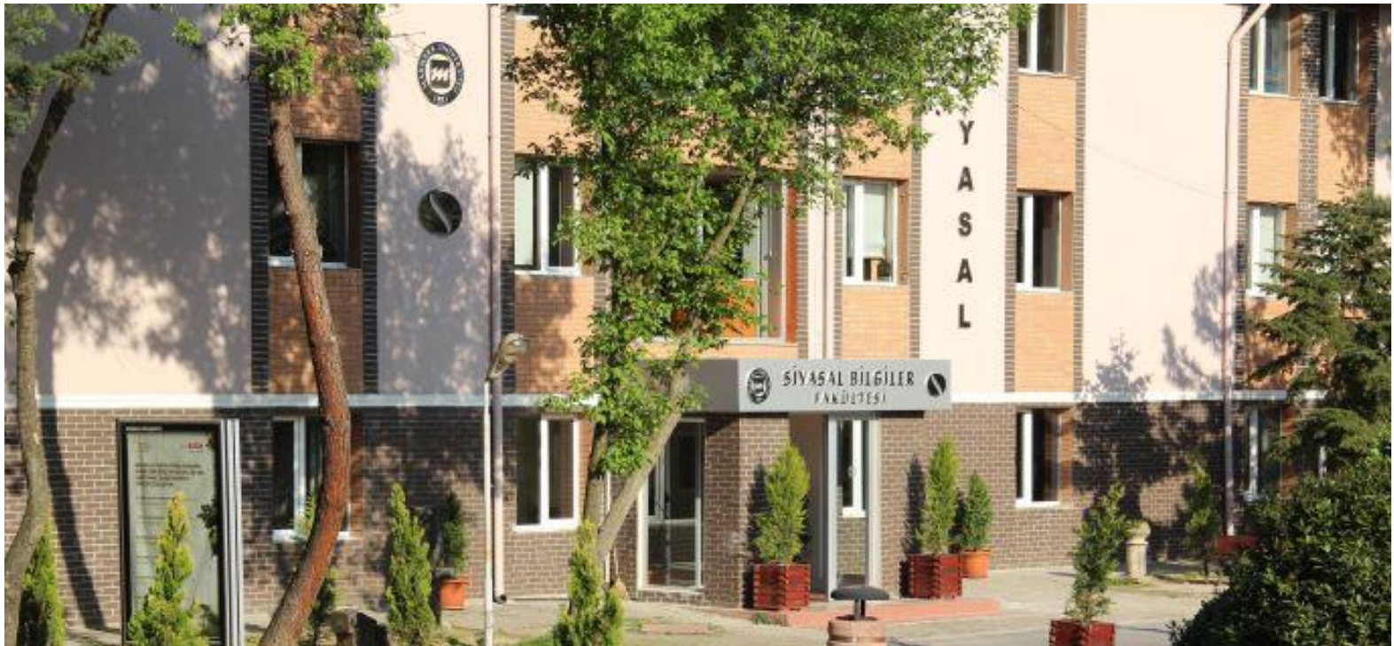
Department of Political Science and International Relations