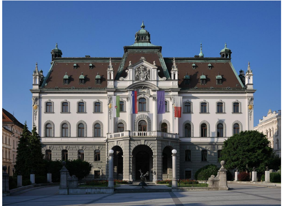
Hauptgebäude der Universität Ljubljana