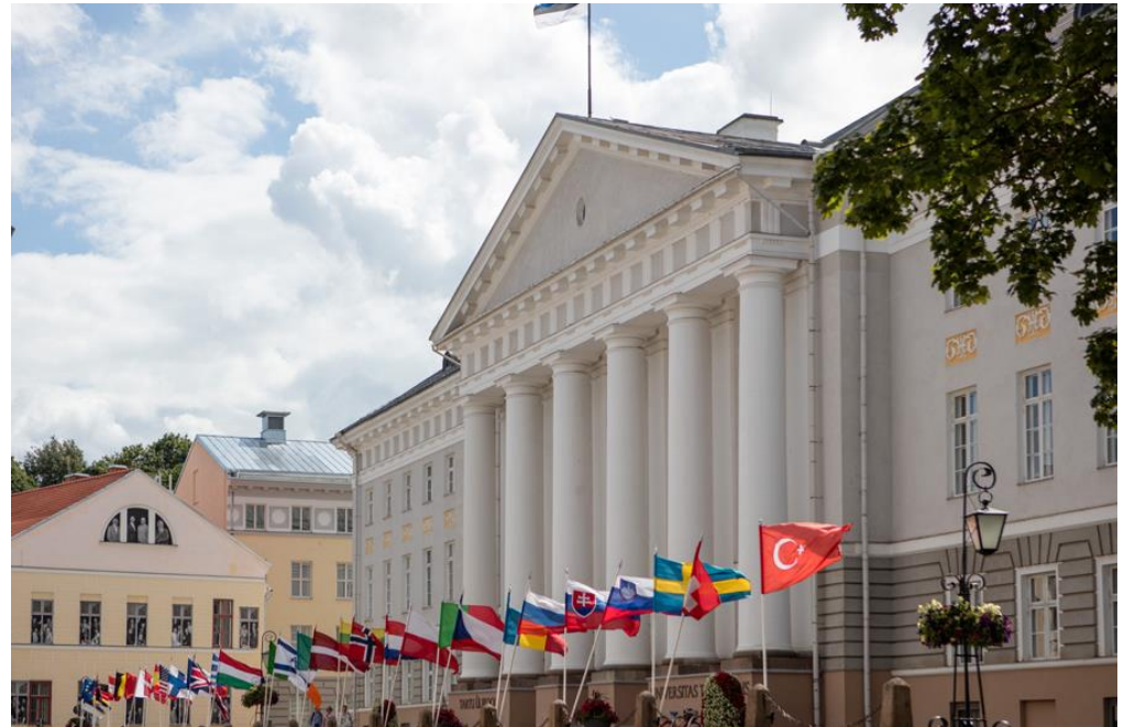
Hauptgebäude der Universität Tartu