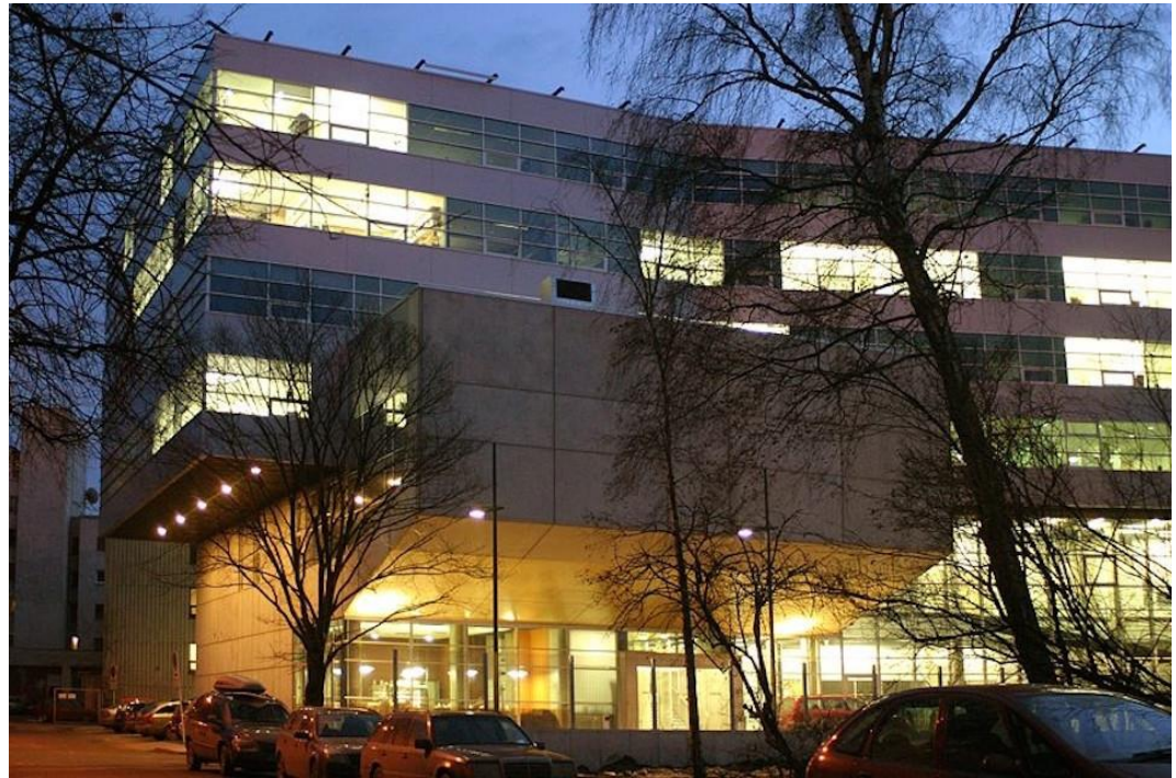
Hauptgebäude der Tallinn University