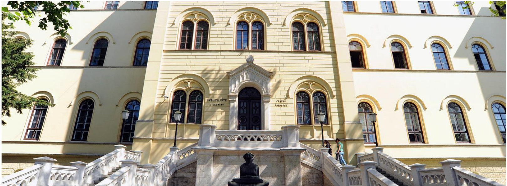
Hauptgebäude der Universität Zagreb