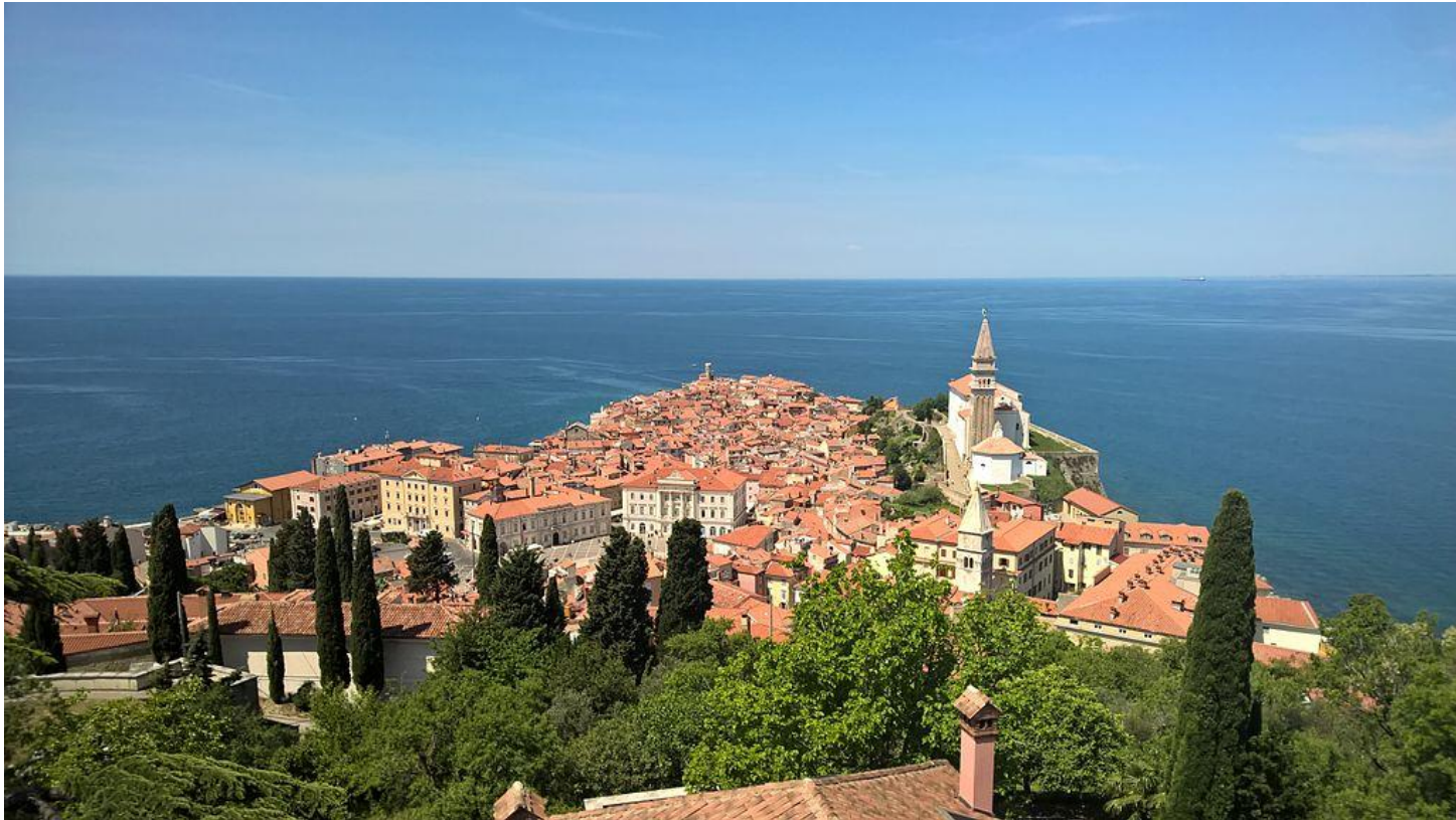
Altstadt von Piran an der slowenischen Adriaküste