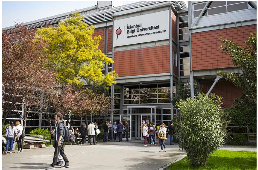
Hauptgebäude der Istanbul Bilgi University