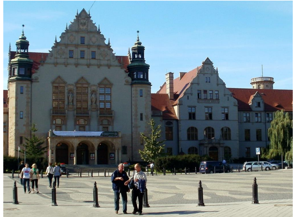
Hauptgebäude der Adam-Mickiewicz-Universität Poznan