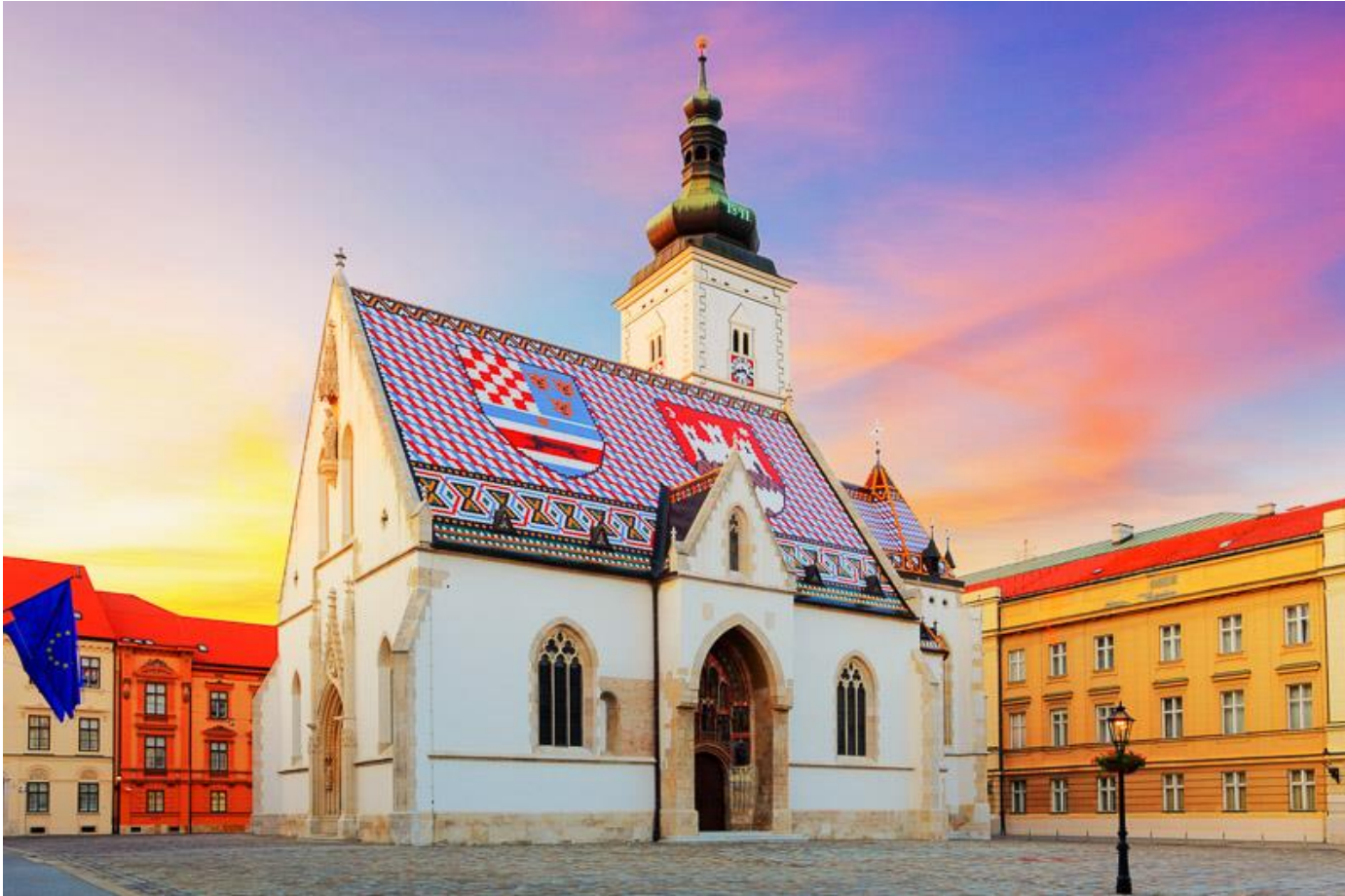
Sankt-Markus-Kirche in Zagreb