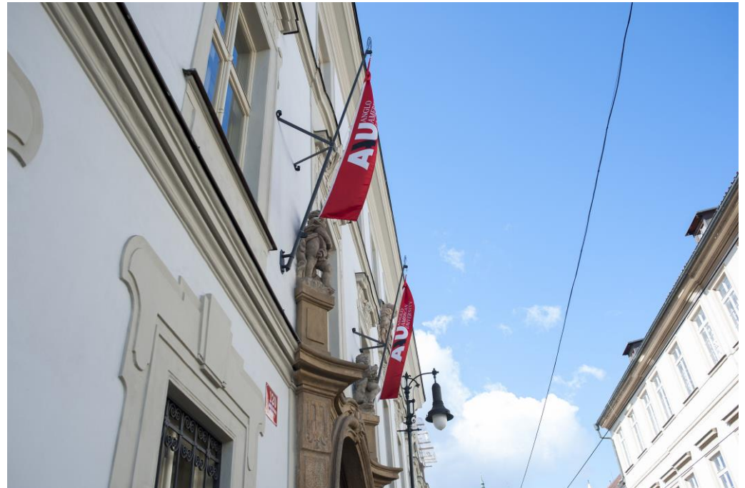
Hauptgebäude der Anglo-American University