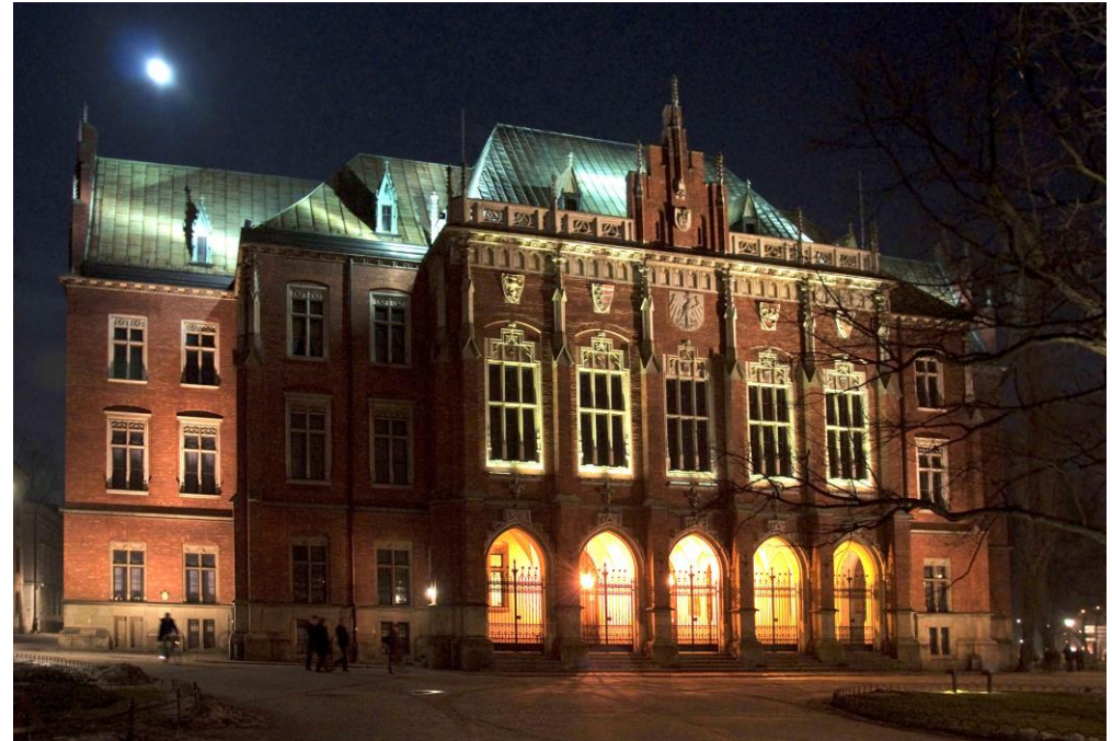
Hauptgebäude der Jagiellonian University